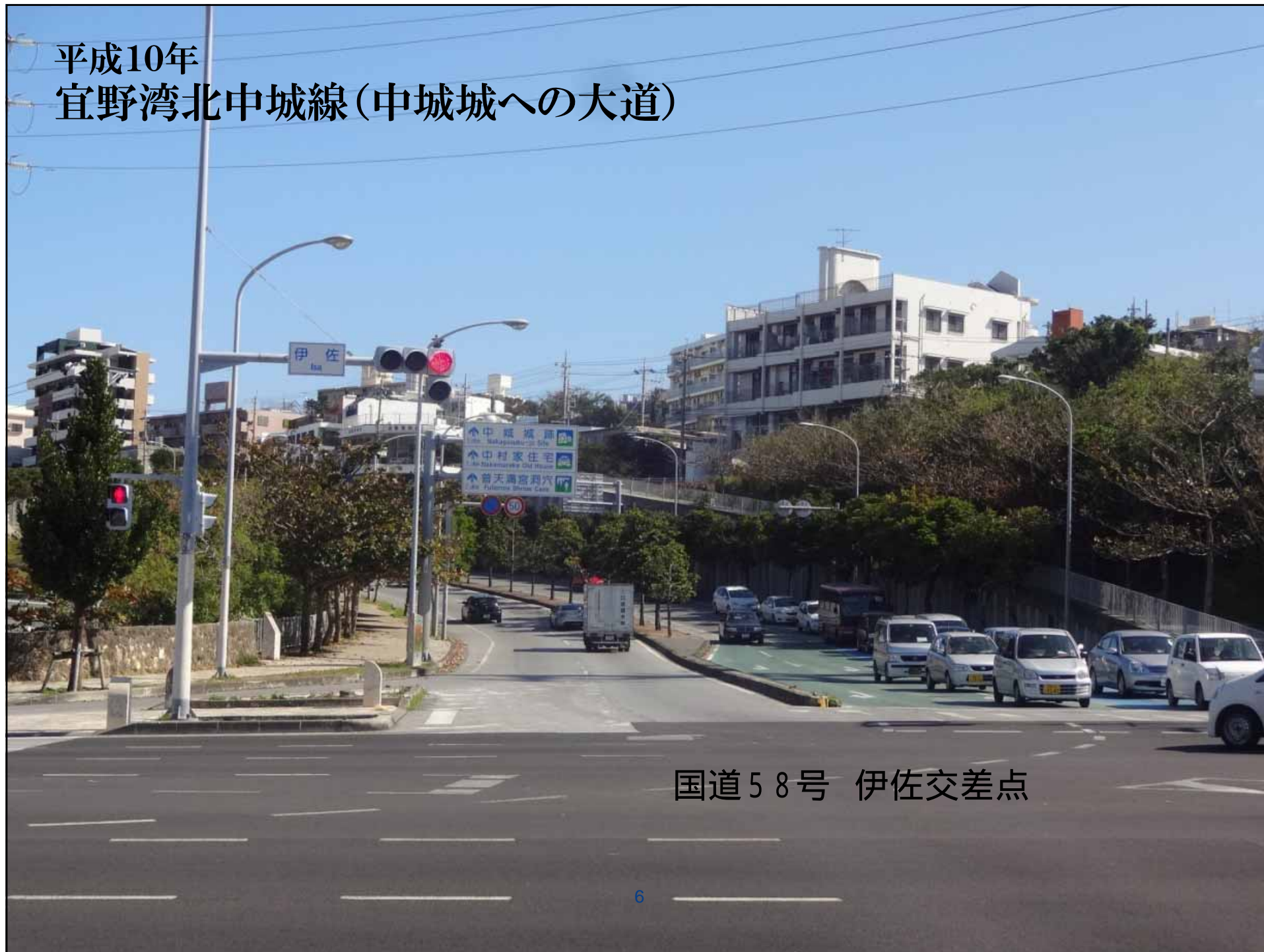
国道58号 伊佐交差点