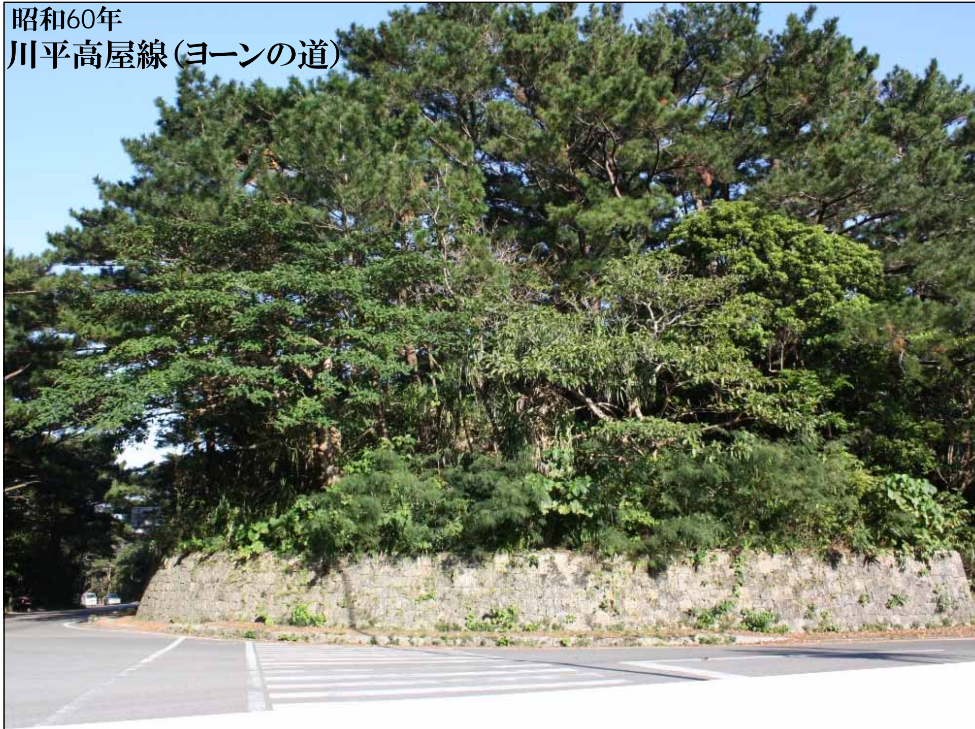
昭和60年 川平高屋線(ヨーンの道)